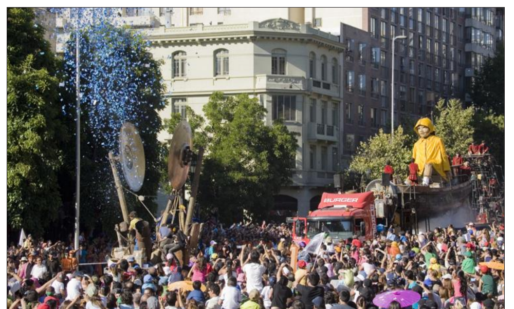
Comme ici à Berlin, les spectacles proposés par Royal de Luxe constituent à chaque fois des créations originales qui s'inspirent de la ville où elles sont jouées.

Reste que l'enjeu en vaut la peine. « Liverpool a commandé une étude pour mesurer les retombées de la venue de Royal de Luxe. Il en était ressorti que pour chaque pound investi, il y en a eu 7 en retour » relevait Sami Kanaan. Qui finiront peut-être aussi un peu de notre côté de la frontière... S.C.