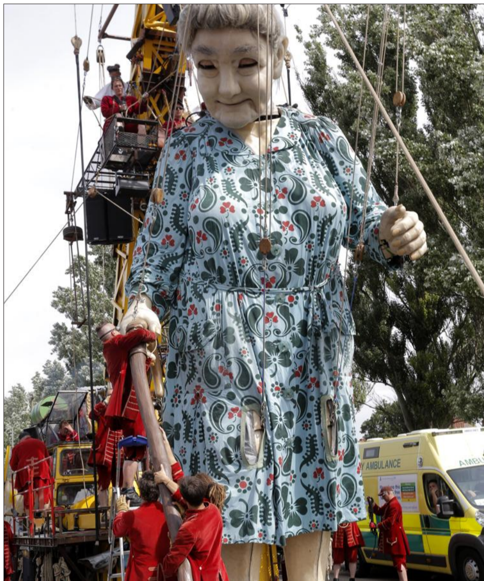
La grand-mère sera présente à Genève pendant trois jours et vivra véritablement dans la ville avec ses lilliputiens. Les détails des parcours ne seront dévoilés qu'un peu plus tard.

Cette création réalisée pour l'occasion est intitulée "Le chevalier du temps perdu". Elle tournera autour du temps, Jean-Luc Courcoult ayant visiblement été inspiré par la présence de l'horlogerie et du Cern. « Je me nourris de la grande histoire de la ville et de ses légendes pour faire un spectacle populaire. » Guère plus de détails pour l'instant, pas plus que sur les parcours d'ailleurs, Royal de Luxe ayant un art consommé pour